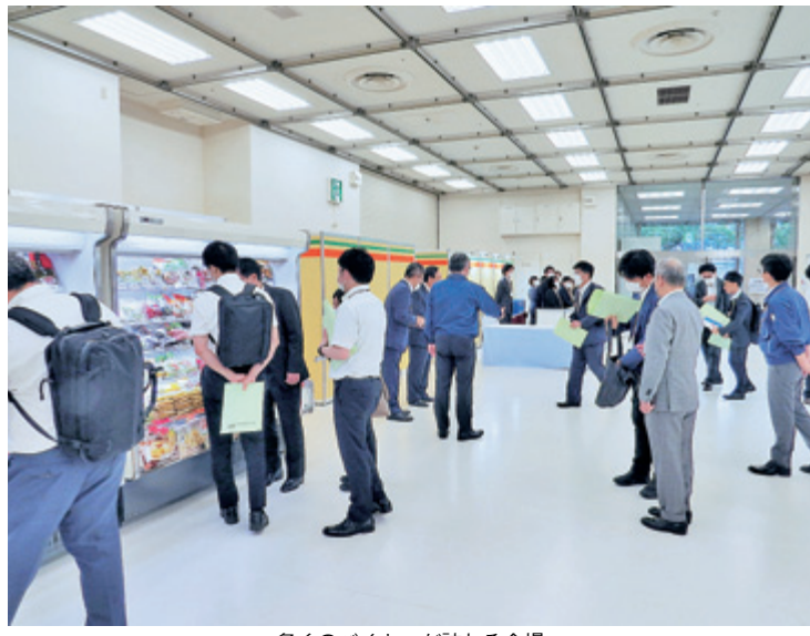
多くのバイヤーが訪れる会場

中でも2020年と2021年と比べて、SDGsの意識が顕著に高まっている。SDGsへの取り組みが求められ、SDGsの推進が求められている。SDGsの推進が求められている。SDGsの推進が求められている。